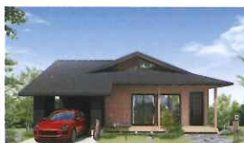
HUCK BASE YEBOSHI BUILT-IN GARAGE ハックベース エボシビルトインガレージ