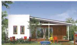
HUCK BASE BERET ハックベース ベレー