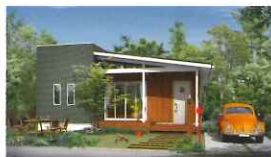
HUCK Retreat BASIC TYPE ハックリトリート ベーシックタイプ