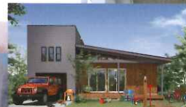
HUCK BASE BERET BUILT-IN GARAGE ハックベース ベレービルトインガレージ