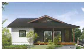
HUCK BASE YEBOSHI ハックベース エボシ